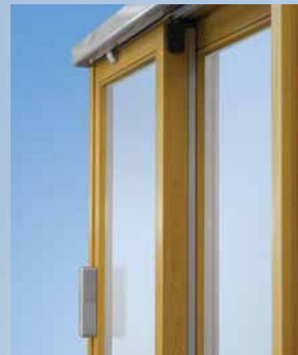
Molteplici funzioni, velocità e movimentazione silenziosa