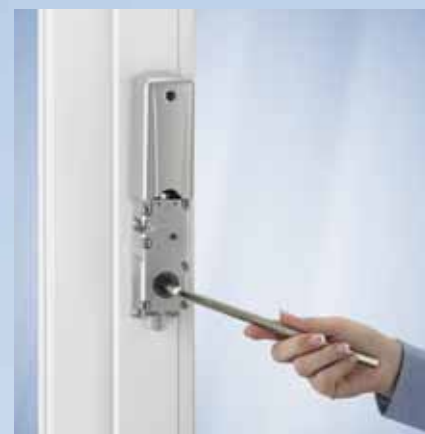
Comando manuale d'emergenza: basta togliere la parte inferiore del coperchio del meccanismo di movimentazione anta e inserire il cacciavite ad angolo in dotazione